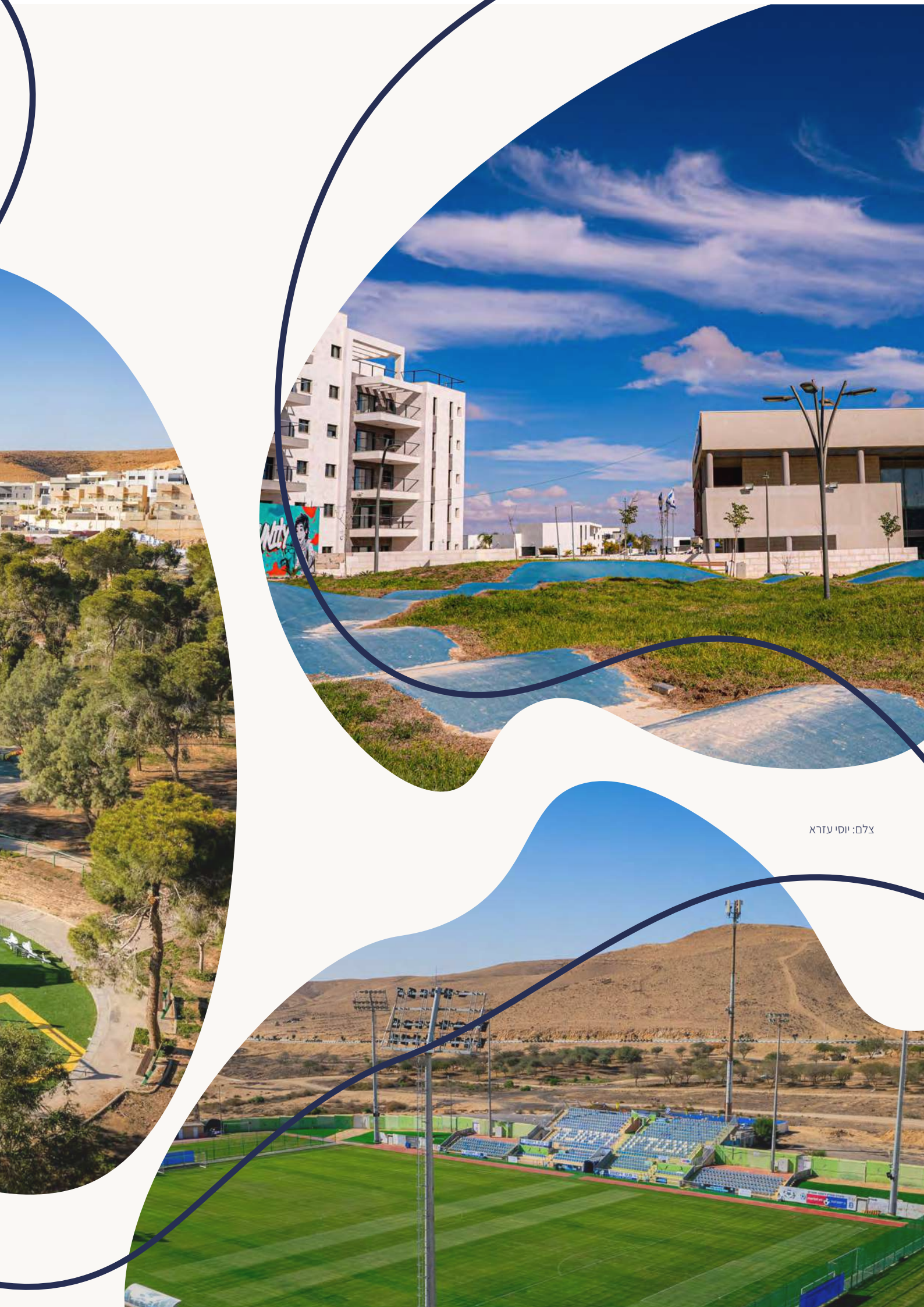
צלם: יוסי עזרא